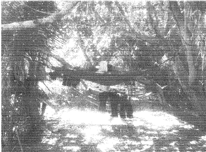
Áreas de vivências usadas pelos resgatados, flagradas durante operação de combate ao trabalho escravo